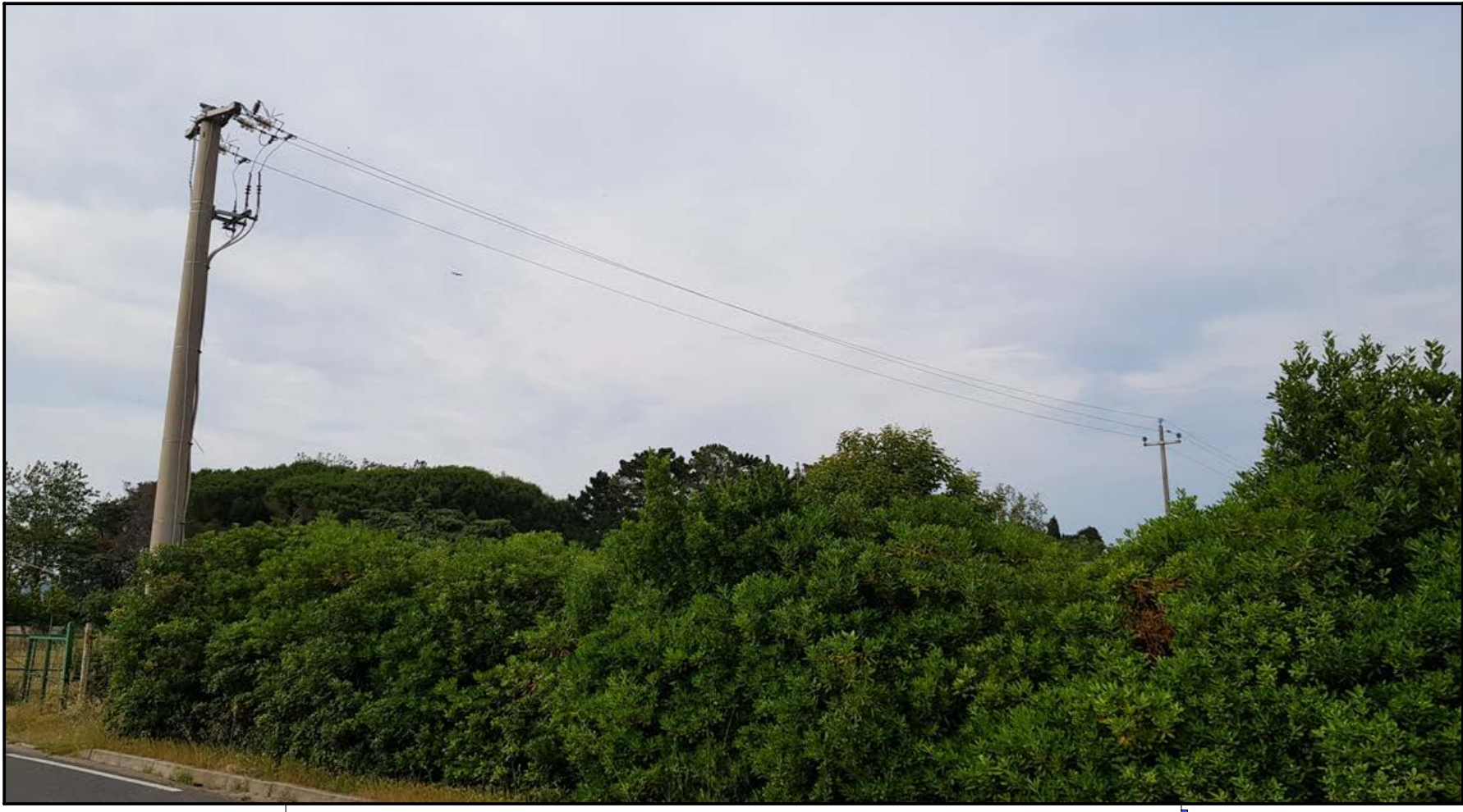
SCATTO FOTOGRAFIA N. 4