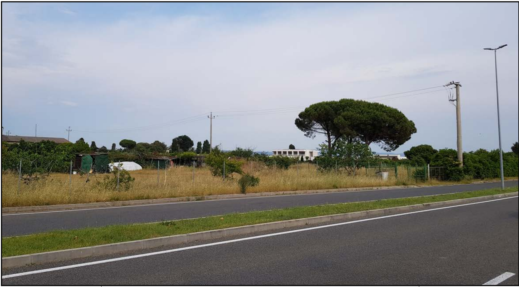
SCATTO FOTOGRAFIA N. 1