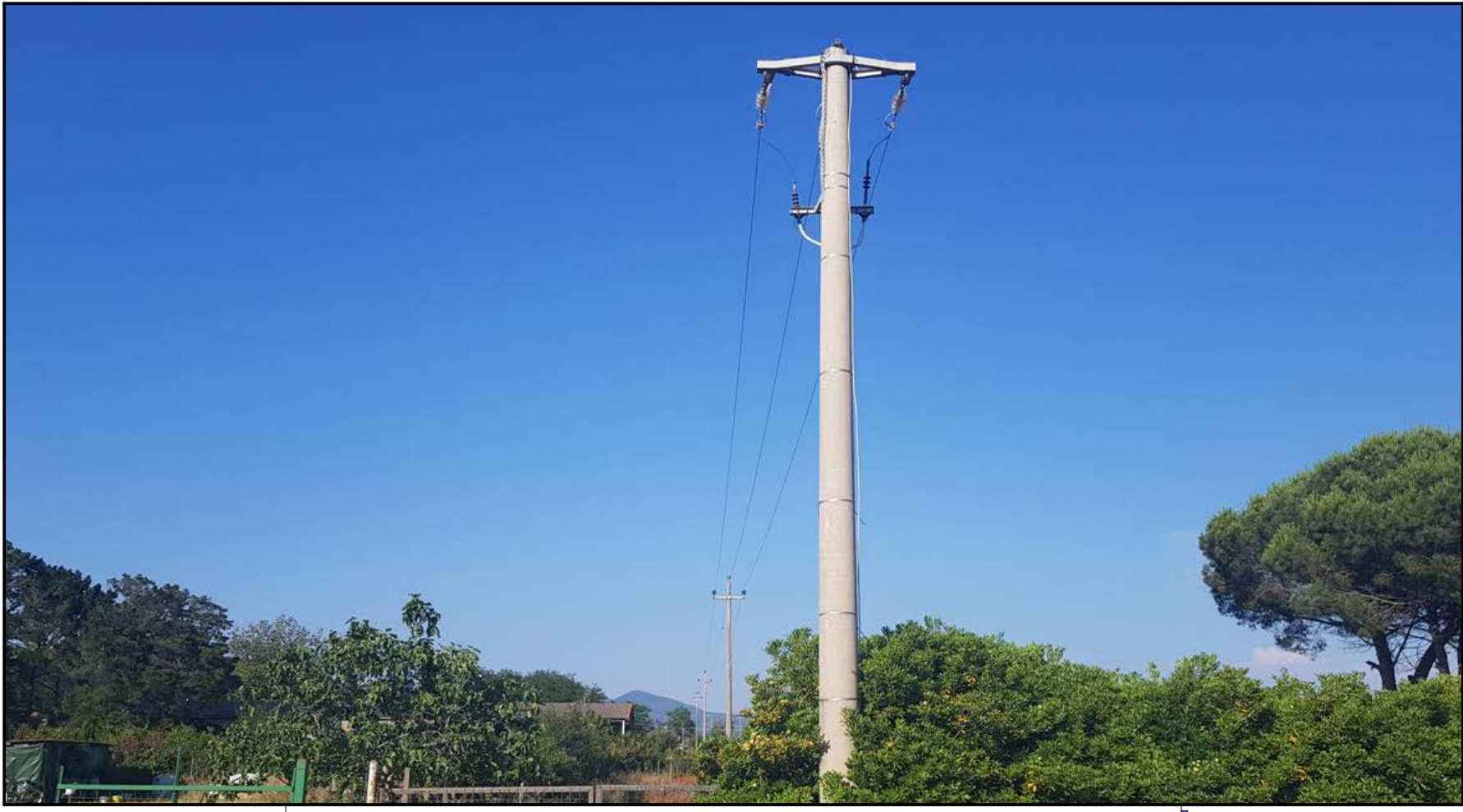
SCATTO FOTOGRAFIA N. 3