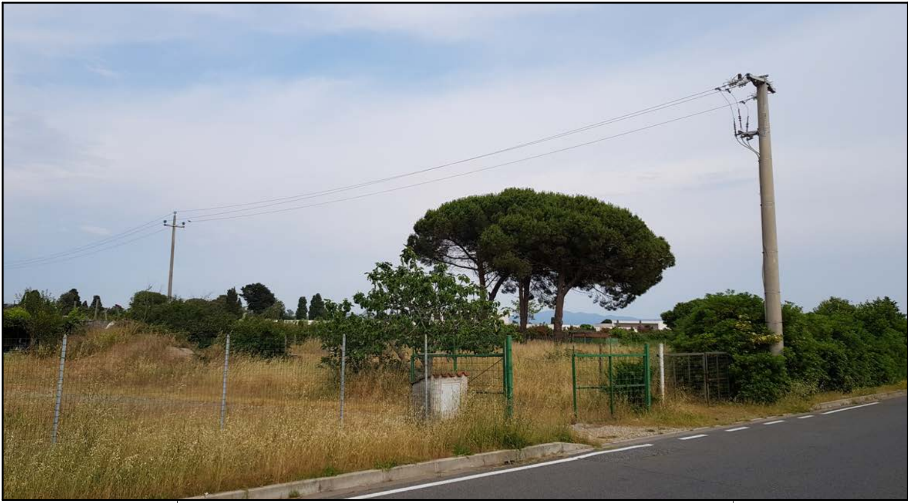
SCATTO FOTOGRAFIA N. 2