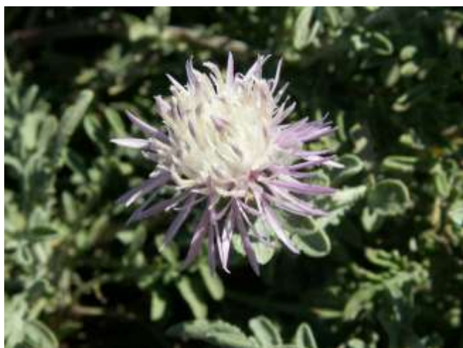
Centaurea paniculata L. Moretti subsp. subciliata (DC.) Arrigoni (vulnerabile)

(*) = specie segnalata nel volume “La Biodiversità in Toscana. Specie e habitat in pericolo”.