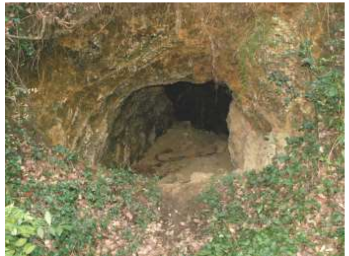
Cavità ipogee, anche artificiali di vario tipo