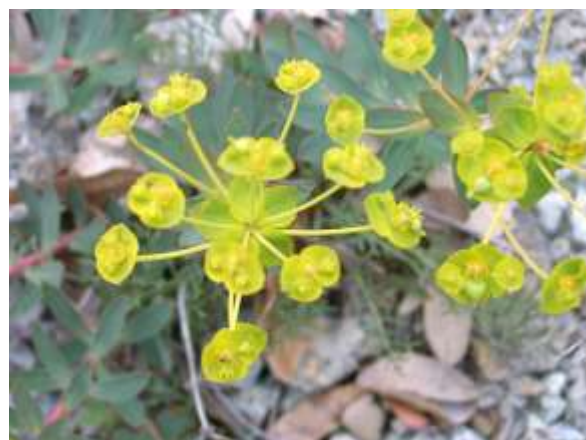
Euphorbia nicaeensis All. subsp. prostrata (in pericolo)