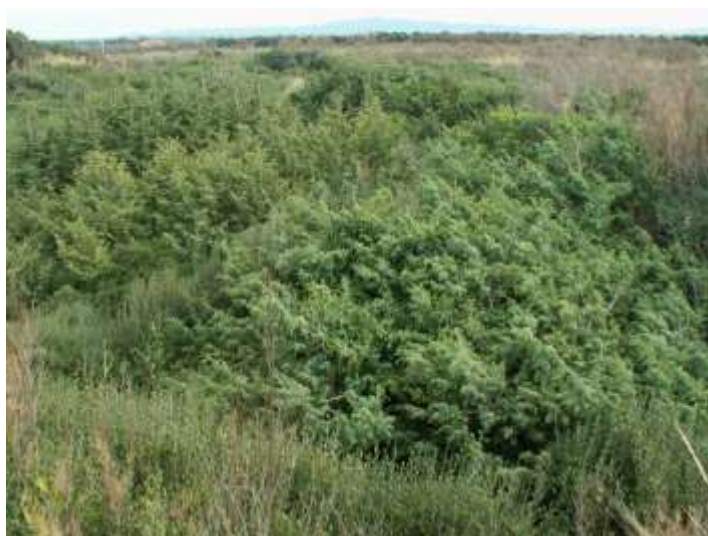
Boscaglia costiera di ginepri