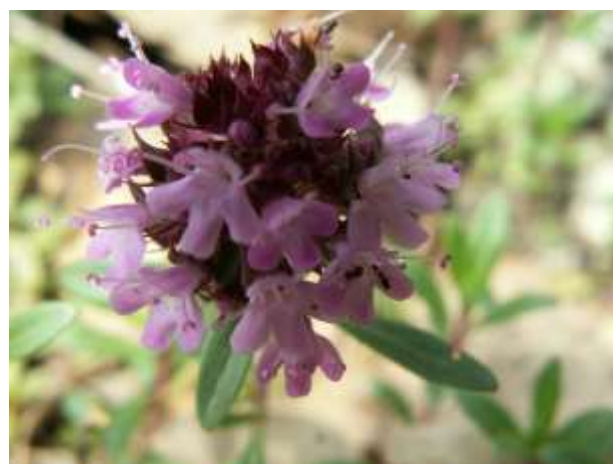
Tymus acicularis W. et K. var. ophioliticus (in pericolo)