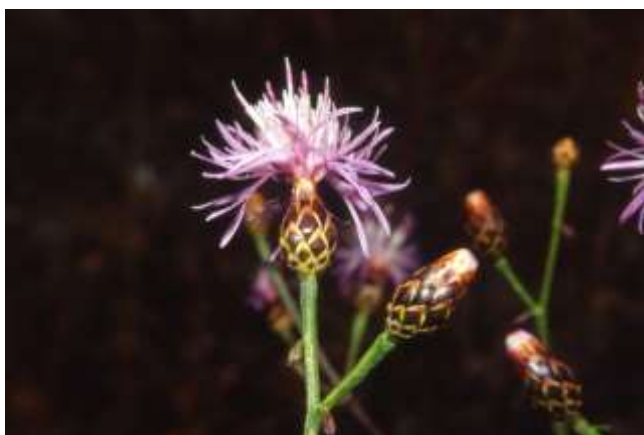
Centaurea paniculata L. subsp. Maremmana (in pericolo)