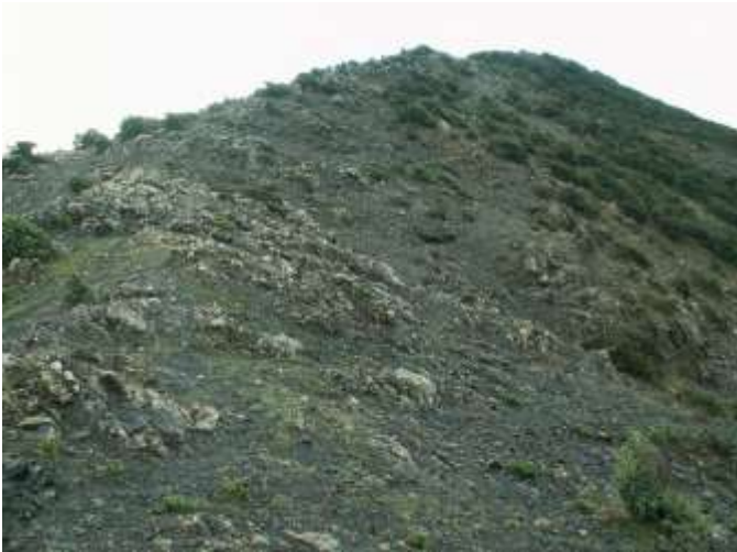
Vegetazione pioniera delle superfici rocciose ultramafiche