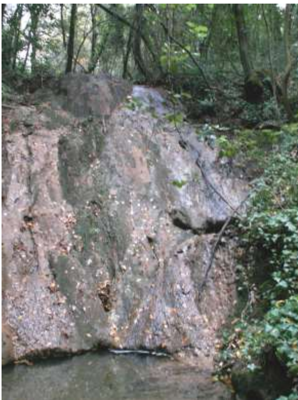
Sorgenti con formazione attiva di travertino