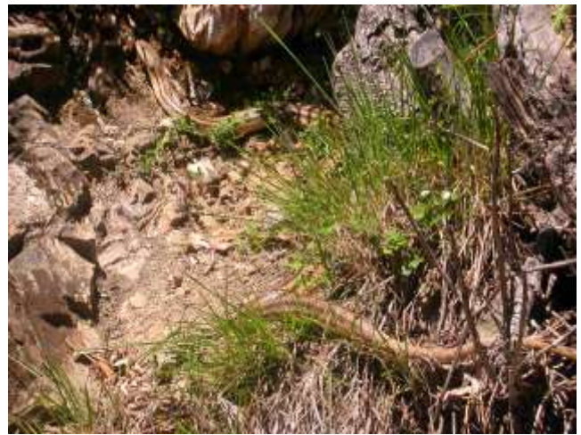
Elaphe quatuorlineata (Cervone)