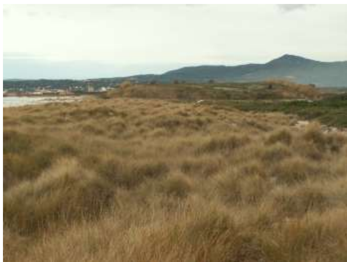
Dune mobili del cordone litorale con presenza di Ammophila arenaria