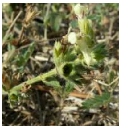
Stachys recta psammophila