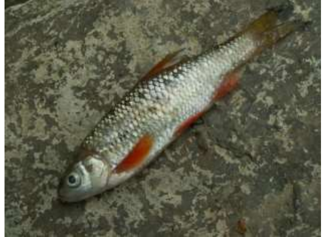
Rutilus rubilio (Rovella)