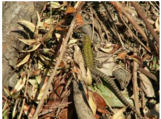
Podarcis muralis (Lucertola muraiola)