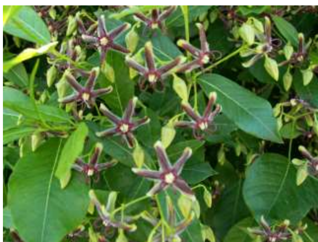
Periploca graeca L. (liana di interesse geobotanico)