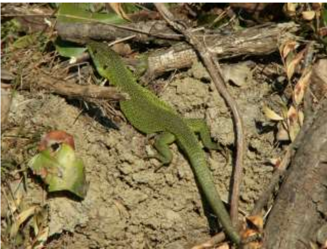
Lacerta bilineata (Ramarro)