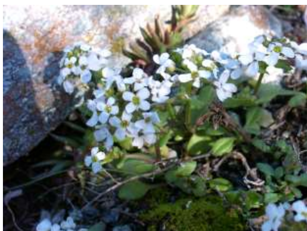
Jonopsidium savianum (Caruel) Ball ex Arcang. (vulnerabile - rara)