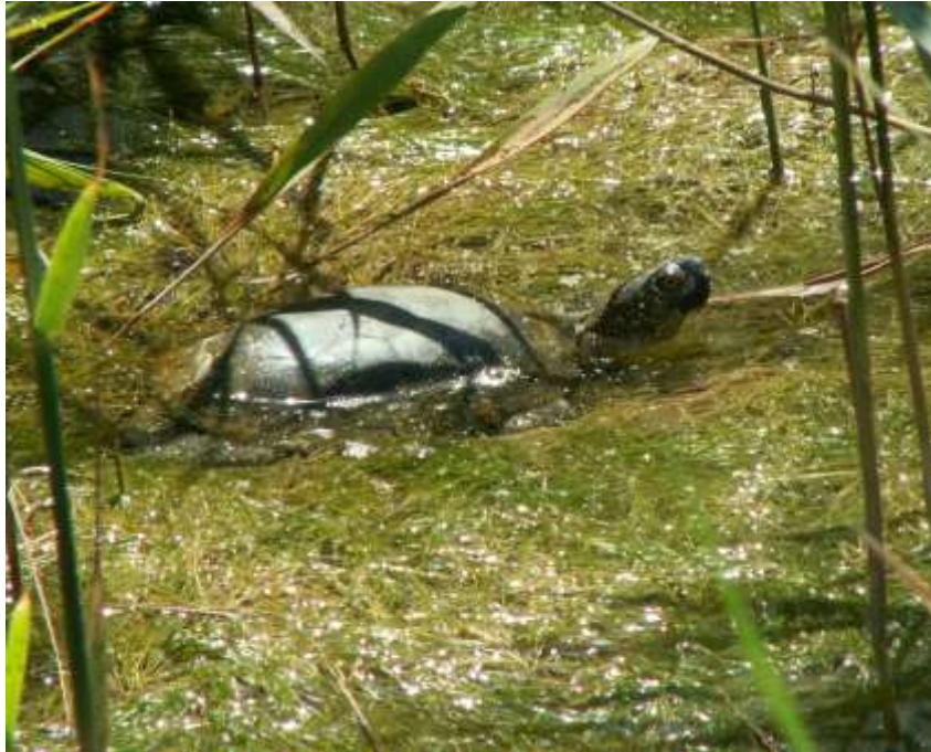
Emys orbicularis (Tartaruga palustre) – Fosso del Tesorino (Luglio 2006)