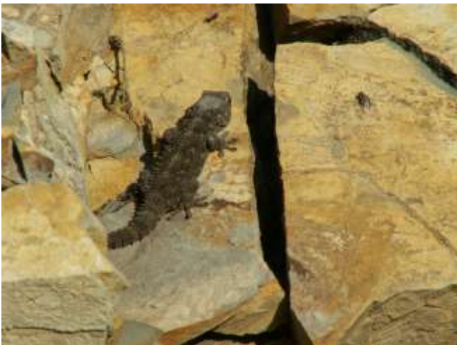
Tarentola mauritanica (Geco)