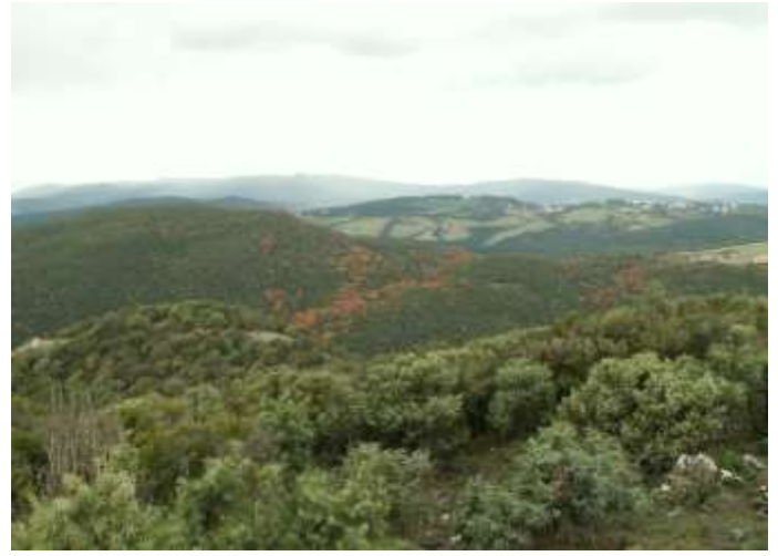
Boscaglie a dominanza di Juniperus oxycedrus dei substrati serpentinosi