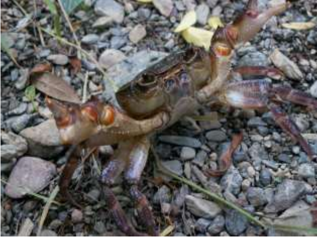
Potamon fluviatile (Granchio di fiume)