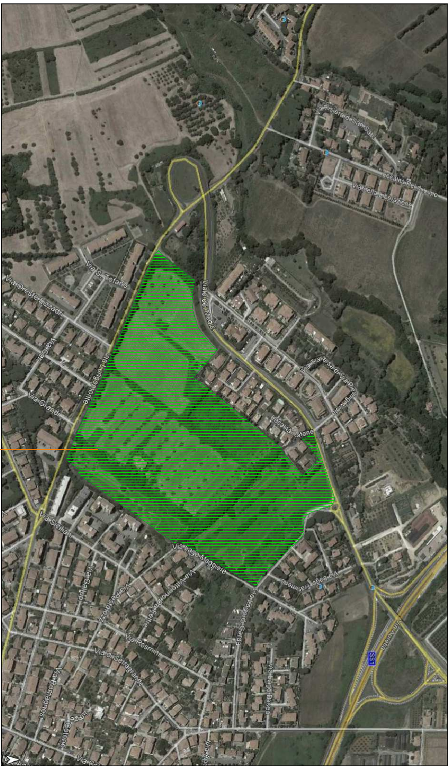
Veduta aerea : comparto edificatorio "loc. cotone" a Rosignano Solvay SCHEDA NORMA 3-3u

collaboratori : Dott. ing. Pasquini Giovanni Dott.Arch. Lucchesi Donato Dott.ing. Tesi dott. geol. Meloni Massimo dott. geol. Meloni geom. Foloni Federico